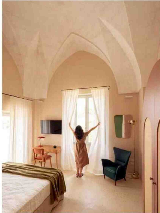
In queste pagine: alcuni scorci, interni ed esterni, da Il Giardino Grande, l'elegante dimora storica immersa nella campagna dell'entroterra salentino.

Camminando tra i sontuosi eremi presenti fra gli ulivi, oasi rigeneranti nella calura salentina, si incontra il Giardino Grande, una dimora storica nella campagna di Parabita, capace di fondere la sua storia antica con un gusto e un servizio cinque stelle. Forte anche della sua posizione, non lontana dalla costa di Gallipoli, la struttura ha numerosi punti e scorci che rievocano alla memoria l'impianto di un'antica masseria. Se tutto nasce da metà Ottocento, quando la struttura era abitata da un'aristocrazia locale nella stagione estiva, ora - in quella che attualmente non è più solo contrada Boggi, ma una destinazione - si svelano esperienze e scelte architettoniche ripristinate a nuova vita. Alle pareti esterne in carparo, alle tipiche volte a botte o a stella, e al cocciopesto risponde quasi un controcanto di motivi geometrici e lineari di nuova concezione, all'atmosfera rilassata e dai colori neutri replica il calore ospitale della gente del luogo. Molti gli scorci, le corti aperte o le nicchie quasi private, contornate da giardini e aiuole o terrazzi esclusivi che si sviluppano all'esterno, in una